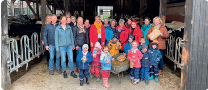
In dem Projekt „Landwirtschaft für kleine Hände“ erleben Kindergartenkinder Landwirtschaft hautnah

Kühe füttern, Sahne zu Butter schütteln und Samen mithilfe von Schafswolle als Dünger pflanzen – bei der Auftaktveranstaltung von „Landwirtschaft für kleine Hände“ am 20. April erlebten