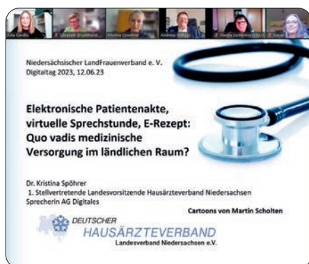
Rund 70 Personen nahmen am Digitaltag teil

Am 12. Juni lud der NLV im Rahmen des Digitaltages 2023 zu einer Online-Veranstaltung zum Thema Digitalisierung im Gesundheitswesen ein. Rund 70 Teilnehmende wohnten der Veranstaltung trotz sommerlichen Wetters vor ihren Bildschirmen bei. Die Veranstaltung trug den