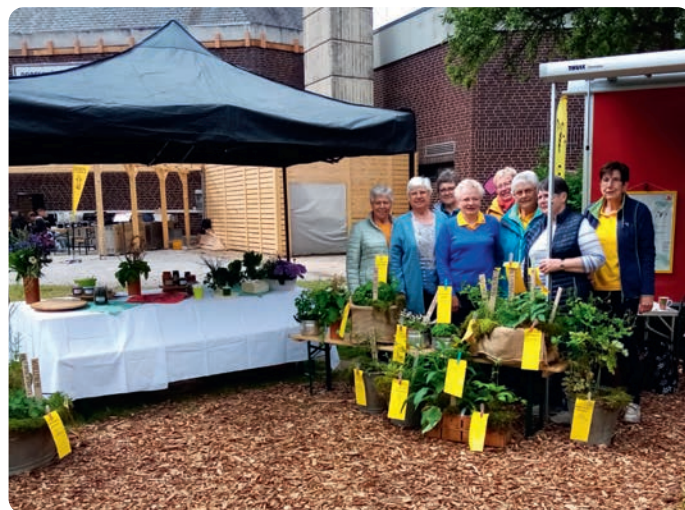
Auf der Landesgartenschau informierten LandFrauen des LandFrauenvereins Westharz über heimische Wildkräuter

Der LandFrauenverein Westharz präsentierte sich am 24. Mai auf der Landesgartenschau Bad Gandersheim im Rahmen des Programms der LandFrauen Bad Gandersheim-Kreiensen mit dem Thema „Heimische Wildkräuter“. Mit einer Vielzahl an Eimern und Wannen voller Kräuterpflanzen fuhren die LandFrauen zur Laga. Spitzwegerich gesellte sich zu Löwenzahn, Sauerampfer und Gundermann, Giersch zeigte sich neben Waldmeister, Bärlauch, Pfefferminze und Brennnesseln. Auch Gänseblümchen, Frauenmantel, Knoblauchrauke und Vogelmiere wurden eine besondere Aufmerksamkeit geschenkt. Viele Besucher der Laga ließen sich zu dem wunderbar gestalteten Gelände des LFV Bad Gandersheim-Kreiensen anlocken. Es kam zu vielen anregenden und guten Begegnungen. Die Frauen erläuterten die naturheilkundliche Wirksamkeit der Kräuter, deren Bedeutung für die Gesundheit und wo sie in der Natur zu finden sind. Auch präsentierten sie anhand von Kostproben, wie Kräuter als Brotaufstrich dienen können – von Löwenzahnsirup bis Waldmeistergelee. Der Tag war ein großartiges Erlebnis.