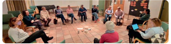
Welche Apps helfen, das Klima zu schützen? Im Workshop ging es um den Zusammenhang zwischen digitalen Lösungen und Klimaschutz

zu kommen. Das Handy länger nutzen und – wenn es nicht mehr zu reparieren ist – bei ausgewiesenen Sammelstellen wieder abgeben, um die verbauten Teile in den Wertstoffkreislauf zurückzuführen oder das Ladekabel nach Gebrauch aus der Steckdose ziehen: Auch wenn es nur kleine Schritte im Klimaschutz sind, jede*r Einzelne von uns kann einen Beitrag dazu leisten.