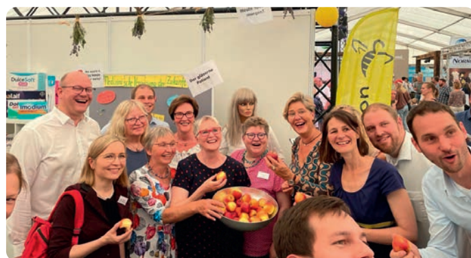
Der NLV spricht mit seinen Besucher*innen über die medizinische Versorgung der Zukunft und verteilt leckere Elbe-Äpfel als Give-Away. Mit auf dem Bild: Miriam Staudte, Niedersächsische Ministerin für Ernährung, Landwirtschaft und Verbraucherschutz.

rund um das Thema „Frauen in der Landwirtschaft – wo sind die Hofnachfolgerinnen?“.