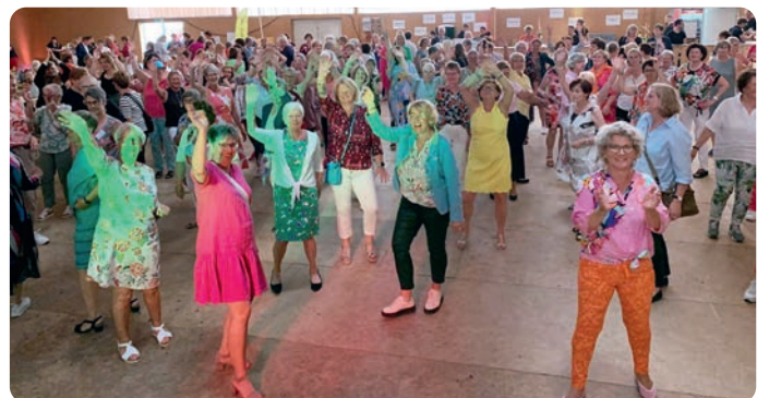
Bei der Party zum 75. Jubiläum des NLV hieß das Motto „Wir sind bunt!“