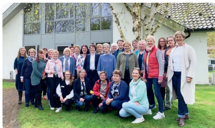
Ein Gruppenfoto der LandFrauen zum Projektausklang darf nicht fehlen

Schön ist es miteinander schweigen, schöner – miteinander zu lachen.