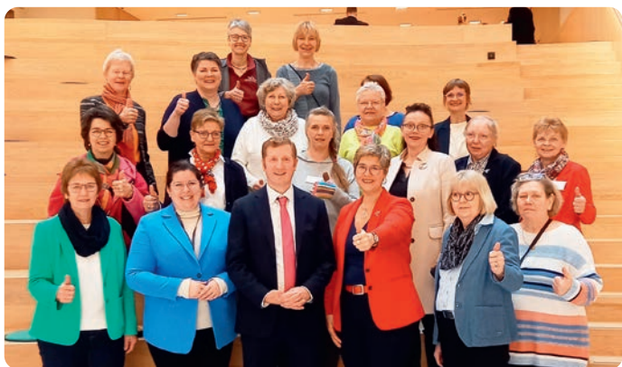
Auf den Spuren des Europäischen Parlaments. Mit auf dem Foto: Die Abgeordneten Lena Düpont (CDU) und Jan-Christoph Oetjen (FDP)

Politisch interessierte LandFrauen des NLV haben im Vorfeld der Europawahl am 9. Juni 2024 mit den EU-Abgeordneten Lena Düpont (CDU), Jan-Christoph Oetjen (FDP) und Viola von Cramon-Taubadel (Bündnis 90/Die Grünen) über die gerechte Aufteilung der Care-Arbeit, Migration in der EU und die Relevanz der Europawahl gesprochen.