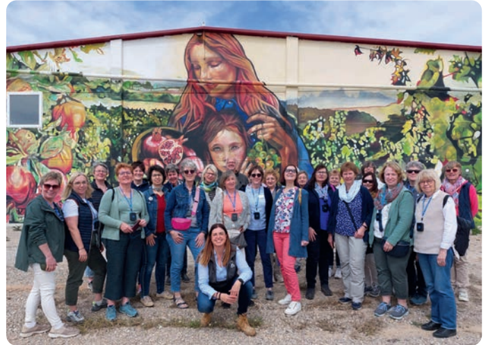
¡Por favor, sonrie! (dt.: Bitte lächeln!) LandFrauen erleben Landwirtschaft in Katalonien

figer solche Lehrfahrten anbietet“, berichtet Eschenhorst. Der Besuch war ein Gegenbesuch, nachdem die Dones món Rural im Herbst 2022 in Niedersachsen zu Gast waren.