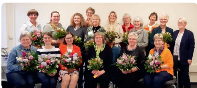
Ehemalige und neue Vorstandsmitglieder des KV Northeim erhalten Blumensträuße als Dankeschön

Am 9. April 2024 fusionierten der Kreisverband der LandFrauenvereine im Altkreis Einbeck und der KreislandFrauenverband Northeim